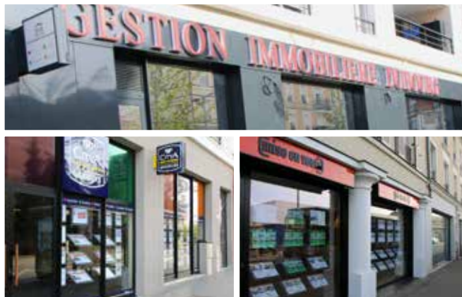
Les agences immobilières fleurissent au milieu des commerces de services peu propices à générer le flux de consommateurs pour les commerces de proximité.

Le patrimoine acquis avec rigueur, année après année, a été le seul outil efficace afin de maîtriser la destination des commerces et permettre la préservation de l'équitable, extrêmement fragile, dans nos centres-villes.