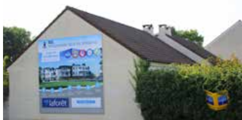
Les espaces de vente et espaces publicitaires, mettant en avant les projets immobiliers, envahissent nos rues.

clairement identifiées et sont aujourd'hui reprises par la nouvelle équipe avec des modifications fortes qui ne vont pas dans le bon sens à nos yeux.